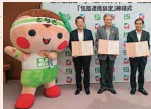
栃木県とヨークベニマル、イトーヨーカ堂との「包括連携協定」締結式